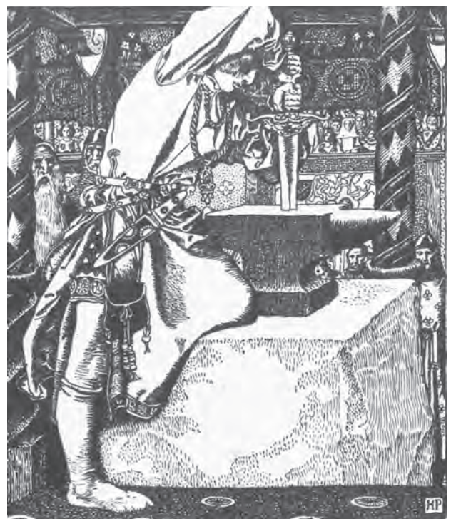
Arthur drar svärdet ur stenen. Teckning av Howard Pyle 1903.