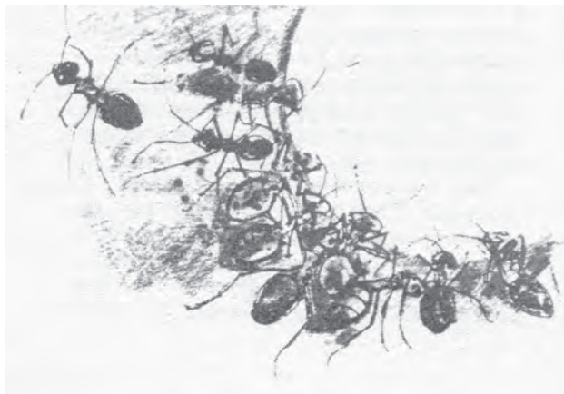
Teckning: Trevor Stublely.

White ansåg att Malory i Le Morte d'Arthur egentligen strävade efter att finna ett botemedel mot krig, och tog själv över denna strävan. I ett brev skrev han: ”Vad kan vi då lära oss av djuren, när det gäller att avskaffa krig?”. Tyvärr blev hans eget verk ett offer för kriget eftersom det fullständiga och omskrivna verket som var