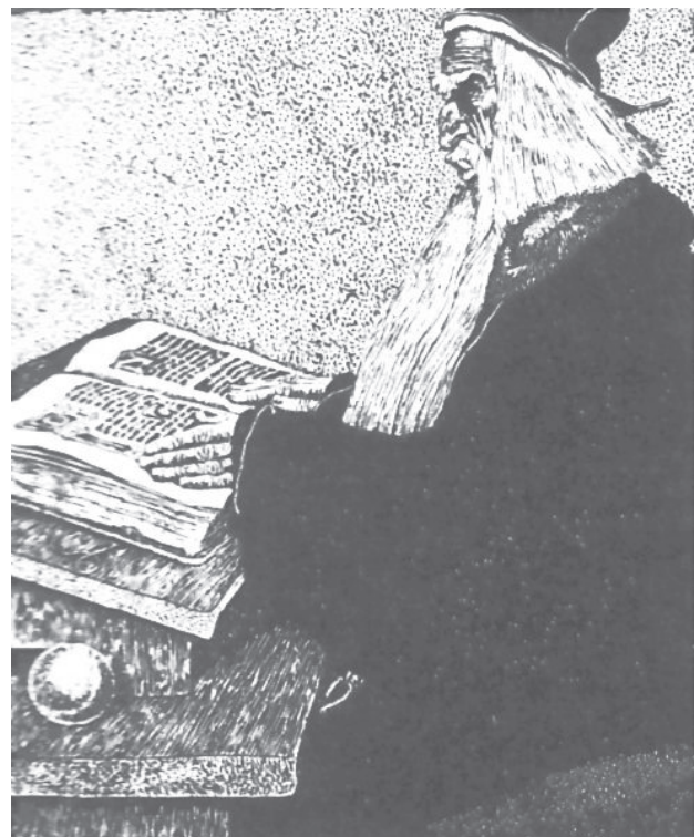
Trollkarlen Merlyn. Teckning av Howard Pyle 1903.

Så man tog fram några myrbon från flugskåpet där de stått på vattenfyllda tefat. De ställdes ner på ett bord mitt i rummet. Alla djuren satte sig runt omkring för att studera dem, för man kunde se vad som försiggick inne i myrbona med hjälp av glasskivor som färgats röda. Arthur fick